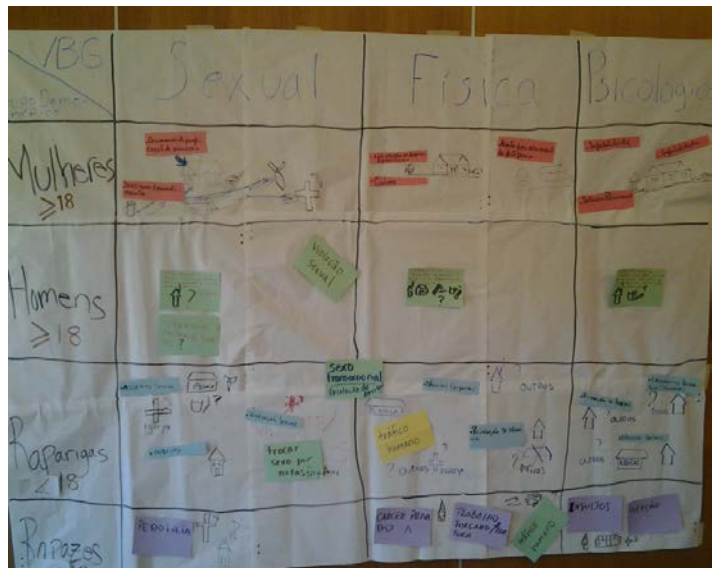
Gráfico de Parede Contendo Tipos e Definições Identificados

Para o passo final do exercício, coloque fitas vermelhas em frente do gráfico. Peça aos participantes para reanalisarem os tipos de VBG que identificaram e avaliem o nível de risco que cada um apresenta para transmitir ou contrair HIV. Para ajudar a facilitar este processo o formador deve saber como é que a VBG pode aumentar o risco de contrair HIV tanto directamente (por exemplo, trauma físico causado por uma relação sexual forçada) quanto indirectamente (por exemplo, ameaças e coerção que diminuem a capacidade das mulheres de negociarem o uso do preservativo). Os participantes podem ter a necessidade de pensar sobre as formas condutoras indirectas que podem aumentar o risco ao HIV, nomeadamente abuso verbal ou controlo sobre os recursos. Eles devem colocar fitas de cor vermelha nos tipos de VBG que estão associados com um aumento de risco de HIV.